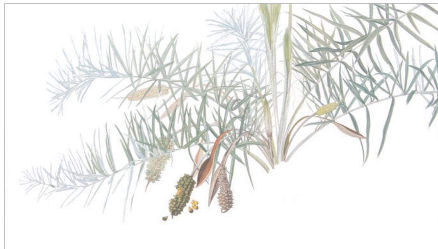
▲ Allagoptera , 2009 Acquarello e dry brush su carta cm 53 x 106

Nel 2008 la Galleria Nazionale di Bergamo, il GAMEC, le dedica una mostra personale.