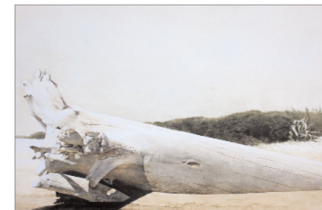
◀ San Genesio , 2009 Dry brush, china e acquarello, intelaiato, cm 177 x 54

Raggiunge in breve punte di qualità sbalorditive che lo elevano a migliore pittore vivente di questo genere. Le sue opere sono tecnicamente impareggiabili, ma è lo sguardo poetico con cui tratta paesaggi, animali o le nature morte che ammalia chiunque osservi i suoi dipinti. È ritenuto dalla critica più severa il più significativo pittore figurativo dei nostri tempi.