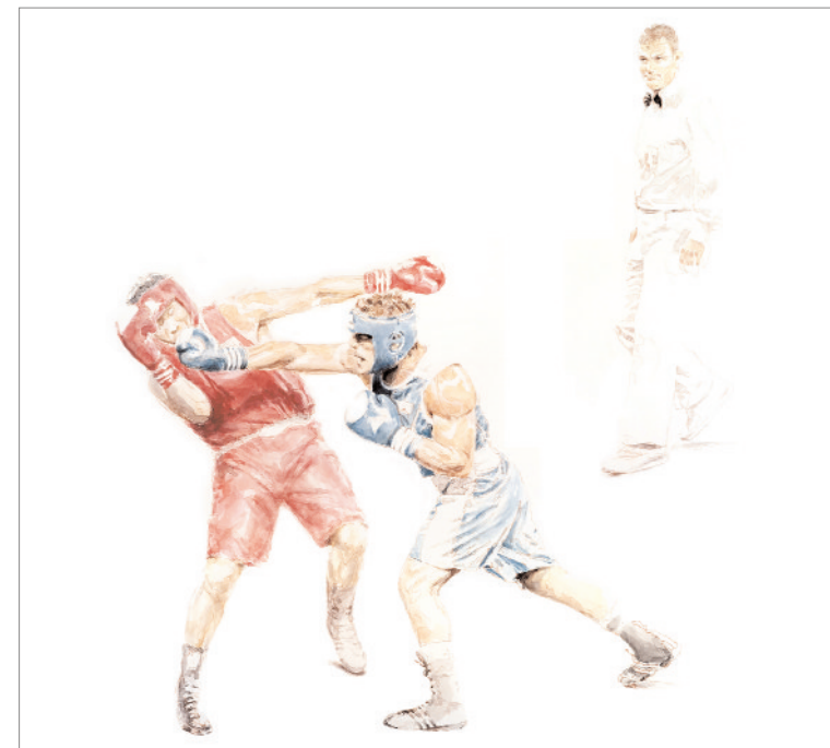
▲ Fight Story # 3 , 2009 Acquarello e dry brush su carta, cm 94 x 96

Nel 1990 si trasferisce a Milano dove fonda, con Stefano Giovannoni, la King Kong Production . Come designer ha contribuito alla realizzazione di oggetti di culto per aziende leader del settore quali: Alessi, Kundalini, BRF. La sua attività di pittore è inedita. Il suo segno è graffiante e incisivo.