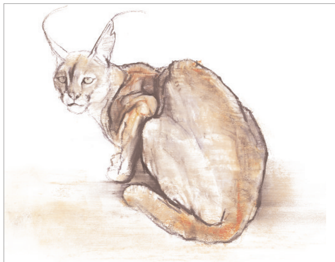
▲ Arabian Caracal , 2009 Dry brush, carboncino e matita su carta cm 59,5 x 77

L'artista espone regolarmente a Londra, in Francia e in Italia; occasionalmente lavora su commissione.