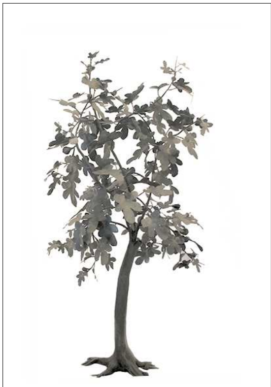
Albero di Fico, 2008 Scultura in ferro battuto, cm 226 x 130 x 137